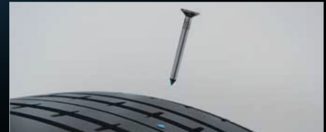
... utesní miesto vpichu, a tým umožní pokračovanie v jazde k najbližšiemu partnerovi Volkswagen.