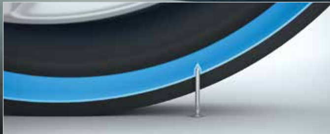
Špeciálna tesniaca hmota vo vnútri pneumatiky ...